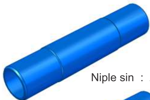
Niple sin : Z