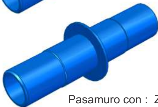
Pasamuro con : Z