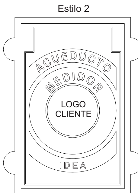
DIMENSIONES GENERALES (mm)